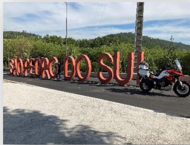
São Pedro do Sul