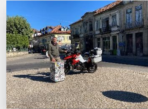
Chaves - Ponte romana – Km 0

Hay que empezar el viaje en el kilómetro 0, en la rotonda cerca del Jardín público de Chaves . Esta es una zona de montañas, rica en aguas termales como las de Chaves, que ya los romanos utilizaban, o las de Vidago y Pedras Salgadas , con un encanto que permite viajar por el tiempo hasta la Belle Époque. La carretera pasa por Vila Real ,