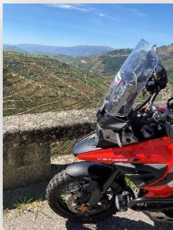
Vale do Douro

Hay que empezar el viaje en el kilómetro 0, en la rotonda cerca del Jardín público de Chaves . Esta es una zona de montañas, rica en aguas termales como las de Chaves, que ya los romanos utilizaban, o las de Vidago y Pedras Salgadas , con un encanto que permite viajar por el tiempo hasta la Belle Époque. La carretera pasa por Vila Real ,