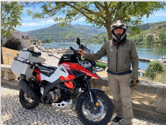
Peso da Reguã

Santa Marta de Penaguião y cruza el Alto Douro Vinícola ; un paisaje único, clasificado como patrimonio mundial por la UNESCO . Se puede visitar el Museo del Duero en Peso da Régua , aquí destacan la tradición vinícola en la más antigua zona vinícola demarcada del mundo . Desde Peso da Régua podemos hacer un extra, si el tiempo lo permite, para recorrer una de las carreteras declaradas más bellas de Europa hasta Pinhao .