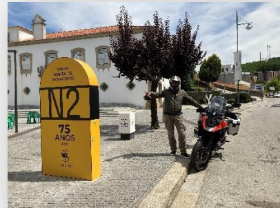
Sta. Marta de Penagão

Santa Marta de Penaguião y cruza el Alto Douro Vinícola ; un paisaje único, clasificado como patrimonio mundial por la UNESCO . Se puede visitar el Museo del Duero en Peso da Régua , aquí destacan la tradición vinícola en la más antigua zona vinícola demarcada del mundo . Desde Peso da Régua podemos hacer un extra, si el tiempo lo permite, para recorrer una de las carreteras declaradas más bellas de Europa hasta Pinhao .